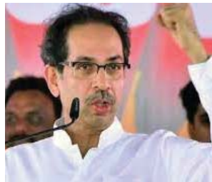
सभी कर्मचारियों को सजग रहने के आदेश दिए हैं। लॉ एंड आर्डर की स्थिति

मुंबई : मुंबई में कहीं किसी जगह पर कोई समूह गद्दार दिवस ना मनाए या किसी प्रकार का आंदोलन या धरना प्रदर्शन ना करें इसको लेकर मुंबई पुलिस हर स्तर पर इस बारे में जानकारी भी इकट्ठा कर रही है क्योंकि आधिकारिक तौर पर किसी जगह और समय के बारे में पार्टियों द्वारा कोई परमिशन की जानकारी नहीं दी गयी है। पुलिस सूत्रों के मुताबिक मुंबई पुलिस ने उद्धव गुट और एनसीपी कार्यकर्ताओं को नोटिस भेजा है और शहर में लॉ एंड आर्डर खराब न करने की चेतावनी दी है।