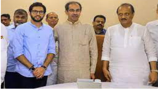
से ये उम्मीद

नई शिंदे-फडणवीस-अजित पवार सरकार पर प्रतिक्रिया देते हुए उद्धव ठाकरे ने कहा है, “सरकार को राज्य के लिए अच्छा काम करना चाहिए. फिलहाल जो भी सच हो उसकी तलाश की जा रही है. उसमें राज्य का मुद्दा है, अभी कहीं बारिश हो रही है तो कहीं बाढ़ का पानी भर रहा है. बारिश