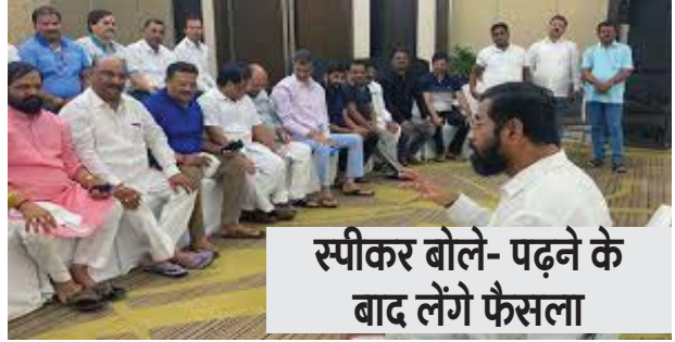
स्पीकर बोले- पढ़ने के बाद लेंगे फैसला

महाराष्ट्र : महाराष्ट्र में शिवसेना के टूटने से बागी विधायकों की अयोग्यता के मामले में जल्द सुनवाई की प्रक्रिया शुरू हो सकती है। शिवसेना (शिंदे गुट) के मुख्यमंत्री एकनाथ शिंदे सहित 16 विधायकों ने इस मामले में 6,000 पन्नों का लिखित जवाब दाखिल किया है। इस पर महाराष्ट्र विधानसभा के अध्यक्ष राहुल नावेंकर ने गुरुवार को कहा कि विधायकों के जवाब का अध्ययन करने के बाद नियमानुसार निर्णय लेंगे। नावेंकर ने कहा कि शिवसेना (शिंदे गुट) के 16 विधायकों ने 6,000 पन्नों के लिखित जवाब में अपना कानूनी पक्ष रखा है। इसे देखने के बाद सभी विधायकों से आमने-सामने बात