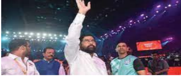
मुख्यमंत्री एकनाथ शिंदे के साथ उपमुख्यमंत्री देवेन्द्र फडणवीस,

मुंबई: एक तरफ सांताक्रुज के पांच सितारा होटल में विपक्षी इंडिया गठबंधन की बैठक चल रही थी, दूसरी तरफ गुरुवार देर रात मुख्यमंत्री एकनाथ शिंदे दक्षिण मुंबई के वर्षा बंगले में महायुति के मंत्रियों एवं विधायकों के साथ डिजर डिप्लोमेसी कर रहे थे। गुरुवार करीब साढ़े आठ बजे शुरू हुए डिजर में