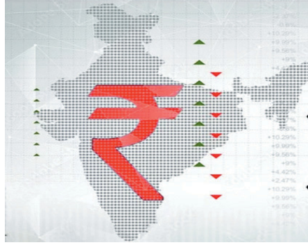
जुड़ी इकाइयों और उद्योग संगठनों के सदस्य शामिल हैं। समिति पर वैकल्पिक निवेश उद्योग के विकास की

इन्फोसिस के सह-संस्थापक एनआर नारायण मूर्ति की अध्यक्षता वाली समिति अब तक एआईएफ उद्योग पर तीन रिपोर्ट दे चुकी है। नारायण मूर्ति के अलावा समिति में सेबी, वित्त मंत्रालय, एआईएफ से