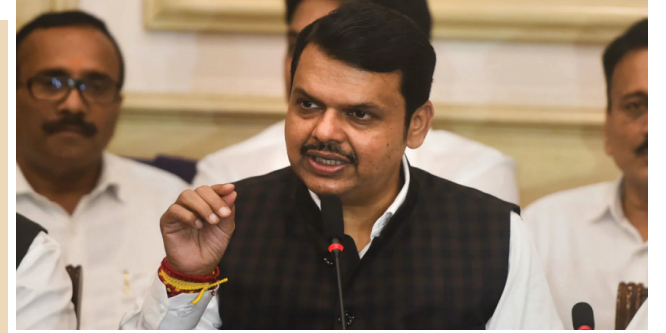
कारण हम पर झूठे आरोप लगाए गए हैं। हमारे गांव में मौजूद लोगों ने हमें बताया कि उन्होंने गाड़ियों को नहीं जलाया।

महाराष्ट्र : महाराष्ट्र के जालना में मराठा आरक्षण के लिए भूख हड़ताल पर बैठे लोगों पर लाठीचार्ज का मामला अब पूरे राज्य में बढ़ता जा रहा है। पुलिस की इस कार्रवाई से मराठा मोर्चा और संगठनों से जुड़े लोगों में गुस्सा है। अब अलग-अलग शहरों में इसका विरोध दिखने लगा है। 3 सितंबर (रविवार) सुबह 11 बजे मुंबई में भी मराठा संगठन से जुड़े लोग आंदोलन कर रहे हैं। यह आंदोलन मुंबई के दादर इलाके में स्थित प्लाजा सिनेमा चौक पर हो रहा है।