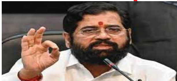
चंद्रकांत पाटिल को ऐसा प्रस्ताव देने का आदेश दिया है. इसके बाद चंद्रकांत

महाराष्ट्र : महाराष्ट्र में ओबीसी और आर्थिक रूप से पिछड़ी लड़कियों के लिए अच्छी खबर है. मुख्यमंत्री एकनाथ शिंदे के आदेश के बाद राज्य के उच्च एवं तकनीकी शिक्षा मंत्री चंद्रकांत पाटिल ने बड़ा फैसला लिया है. जानकारी सामने आई है कि चंद्रकांत पाटिल राज्य में ओबीसी और आर्थिक रूप से पिछड़ी लड़कियों की 100 फीसदी फीस माफ करने की सिफारिश करेंगे. मुख्यमंत्री एकनाथ शिंदे ने खुद