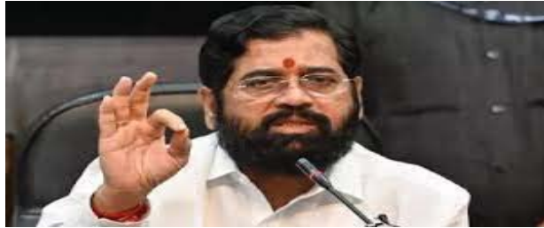
ने मोदी जी का साथ दिया है। जो कहती है वो करती है। लोगों को बीजेपी झूठे प्रचार नहीं करती है। गुमरहा नहीं करती है।

मुंबई : 5 में से 4 विधानसभाओं के चुनाव के वोटों की गिनती जारी है। 4 में से 3 राज्यों में बीजेपी की सरकार बन रही है। मध्य प्रदेश, राजस्थान और छत्तीसगढ़ में बीजेपी कई सीटों पर आगे चल रही है। इस बीच महाराष्ट्र के मुख्यमंत्री एकनाथ शिंदे ने बीजेपी की जीत पर बड़ा बयान दिया है एकनाथ शिंदे ने कहा कि पहले घर-घर मोदी कहते थे अब मन-मन में मोदी हैं।