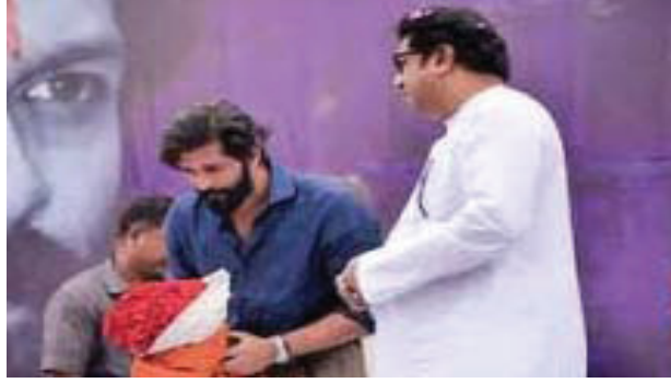
नेताओं का कहना है कि भांडुप, माहिम और मागाठाणे विधानसभा उनके लिए उचित रहेगा, जहां से अमित आसानी से चुनाव जीत सकते हैं।

मनसे के कई नेताओं की मांग मनसे के कई नेता मांग कर चुके हैं कि आगामी विधानसभा चुनाव में अमित ठाकरे को उतारा जाए। पार्टी