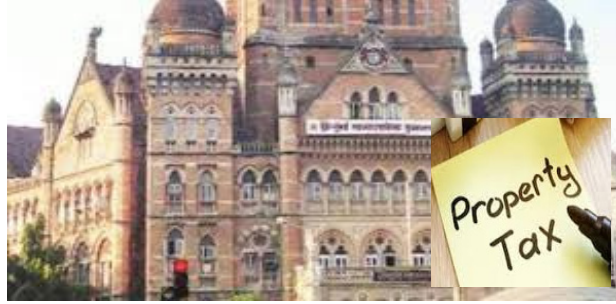
दंड लगाया जाएगा।

बीएमसी ने वर्ष 2024-25 के वित्तीय वर्ष में 6200 करोड़ रुपये प्रॉपर्टी टैक्स वसूलने का लक्ष्य रखा है। लेकिन अब तक बीएमसी के खजाने में 3582 करोड़ रुपये (58%) ही जमा हो पाए हैं। बीएमसी के एक अधिकारी ने बताया कि यदि बकाएदारों ने इस दौरान टैक्स नहीं भरा, तो कठोर