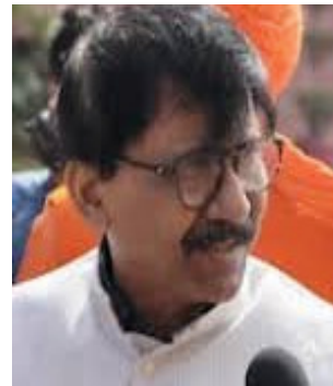
2006 में राज ठाकरे ने बनाई थी एमएनएस

कहा कि महाराष्ट्र नवनिर्माण सेना का इस्तेमाल उद्धव ठाकरे के नेतृत्व वाली शिवसेना (यूबीटी) को कमजोर करने के लिए किया जा रहा है। उन्होंने भारतीय जनता पार्टी (बीजेपी) के नेता और महाराष्ट्र के मंत्री आशीष शेलार की एमएनएस प्रमुख राज ठाकरे से उनके आवास पर हुई मुलाकात को लेकर यह बात कही।